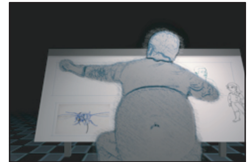
Cliquez ci-dessus pour visionner une entrevue réalisée avec Alexander, un ancien de TransITlon!